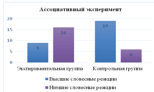
Рис. 1. Результаты исследования процесса мышления экспериментальной группы и контрольной группы методикой «ассоциативный эксперимент»

По результатам методики «Ассоциативный эксперимент» мы получили следующие показатели: