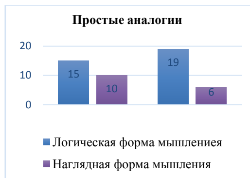
Рис. 2. Результаты исследования процесса мышления экспериментальной группы и контрольной группы методикой «простые аналогии»

ответов, характеру установленных связей между понятиями, с помощью которых можно судить об уровне развития мышления у испытуемых – преобладании наглядных или логических форм.