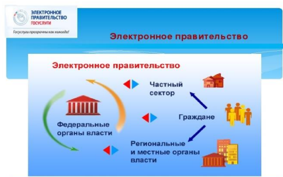
Рис. 1 Схема взаимодействия между государством и заявителями

Принцип взаимодействия между государством и заявителями представлен в виде схемы на рис. 1.