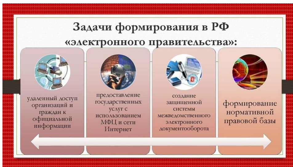
Рис. 2 Задачи формирования в Российской Федерации «электронного правительства»

Направления деятельности электронного правительства: